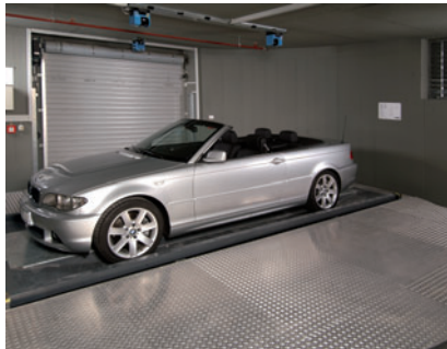
05 Da sich der Übergabebereich im 90° Winkel zur unterirdischen Parkebene befindet wird das Fahrzeug vor dem Einlagern um 90° gedreht

Laserscanners at the ceiling of the transfer area check the correct positioning of the car.