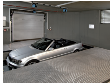
06 und abgesenkt.

As the transfer area is positioned at an angle of 90° towards the parking level the car is turned for 90° before reaching the parking level