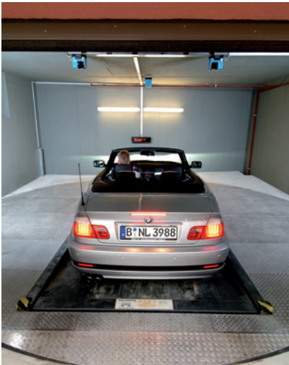
04 Laserscanner an der Garagendecke prüfen die richtige Parkposition des Pkw.

There is only one transfer area on courtyard level necessary from where the car is transported by means of a vertical lift into the parking level. The movements are cycled by longitudinal and lateral shiftings, requiring two empty places within the system.